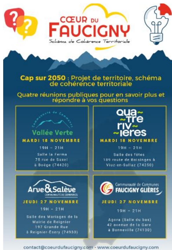
Flyer d'invitation aux réunions publiques consacrées au DOO

Ces réunions avaient pour objectif de présenter au public la traduction opérationnelle du PAS dans le DOO : règles d'urbanisation, objectifs de production de logements, localisation préférentielle du développement, protections environnementales, principes de mobilité et d'organisation commerciale, etc.