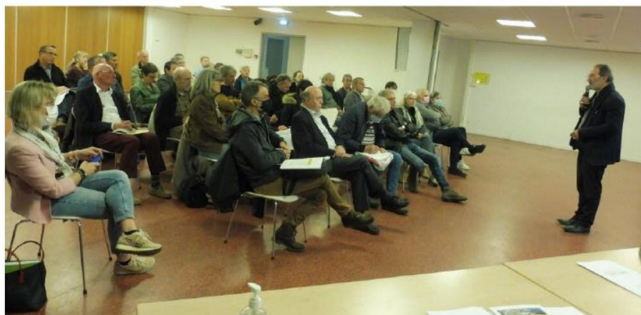
Une cinquantaine de personnes assistaient à cette réunion.

Par Gilles LHOTE - Hier à 18:36 - Temps de lecture : 2 min