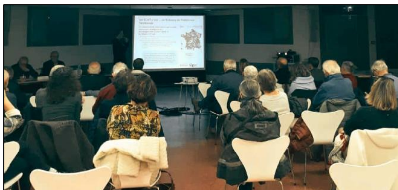
Réunion publique du 27 novembre 2025 – CCFG

Ces réunions publiques ont permis de préciser et de débattre les modalités de mise en œuvre des ambitions du SCoT. Les échanges ont particulièrement porté sur la capacité du territoire à accueillir près de 19 000 habitants supplémentaires d'ici 2046, en conciliant production de logements, développement économique, densification maîtrisée et respect des principes du ZAN.