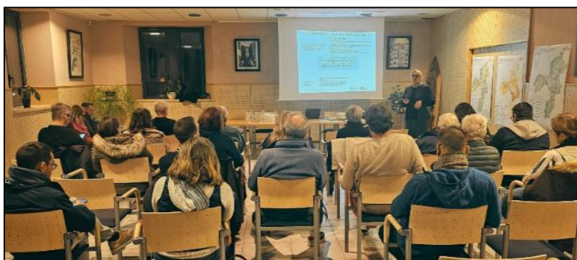
Réunion publique du 27 novembre 2025 – CCAS