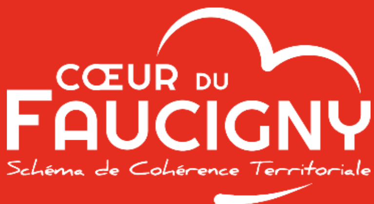
Schéma de cohérence territoriale