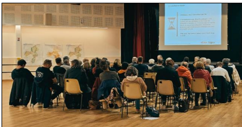
Réunion publique du 18 novembre 2025 – CC4R