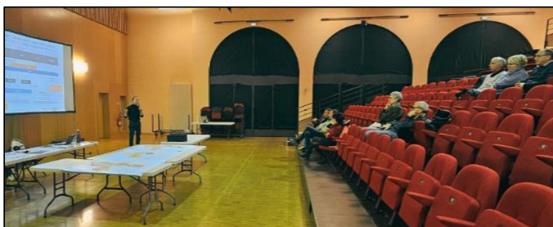
Réunion publique du 18 novembre 2025 – CCVV