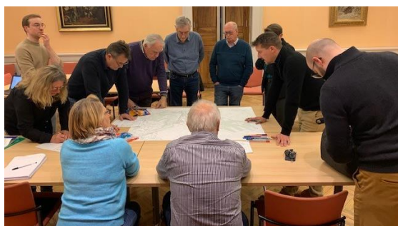
Atelier territorial pour la CCFG – novembre 2024

Pour accompagner ces réflexions, trois ateliers territoriaux sur la cartographie et la traduction spatiale des orientations du DOO ont été organisés le 27 novembre 2024 , réunissant l'ensemble des élus autour du travail cartographique.