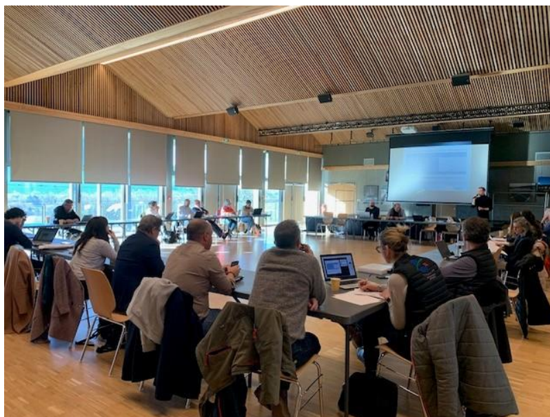
Réunion PPA – 28 novembre 2025 – Présentation et échanges sur le DOO

Les fédérations professionnelles du BTP et de l'extraction (UNICEM, BTP 74) ont quant à elles sollicité une souplesse pour la gestion des déblais et remblais et l'extension/la création de carrières, y compris dans des secteurs sensibles, ce qu'étudiera le Syndicat Mixte sans y être à ce stade totalement favorable.