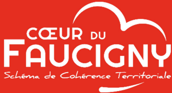
Schéma de cohérence territoriale