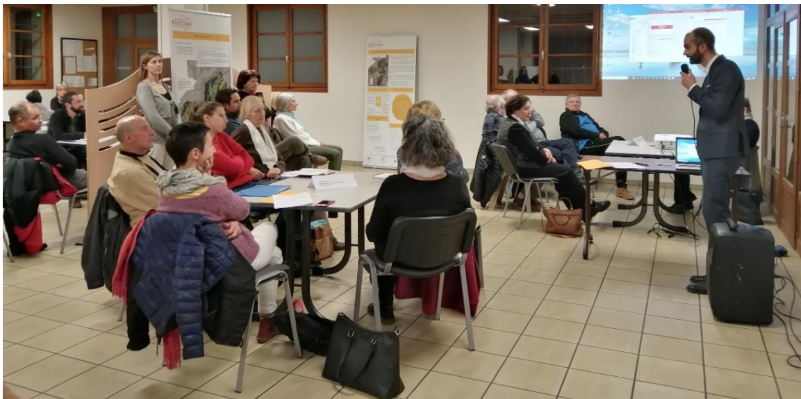
Atelier citoyen – Fillinges – 2020