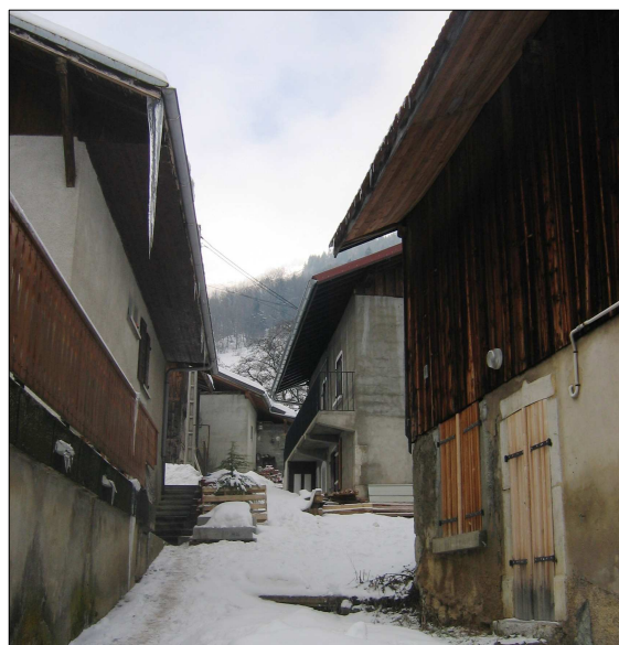
FIGURE 118 - UNE TRADITION DU BÂTI SERRÉ, POUR S'ISOLER DES AVALANCHES ET PRÉSERVER LES MEILLEURES TERRES