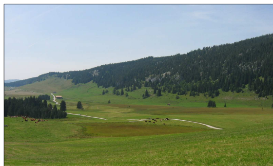
FIGURE 120 - LES GLIÈRES, SYMBOLE DE LA LIBERTÉ

Un projet de liaison par câble pour monter au plateau de Glières et supprimer les véhicules du plateau est étudié par la CCFG. Ce projet relève d'une procédure UTN, rendue nécessaire pour toute opération créant une surface de plancher hors d'œuvre net et d'autres équipements dont la liste est prévue par décret en Conseil d'Etat. Leur implantation doit respecter l'ensemble des règles d'aménagement et de protection inhérentes aux zones de montagnes. Seul le principe d'urbanisation en continuité ne leur est pas applicable, bien qu'elles doivent néanmoins respecter la qualité des sites et des grands équilibres naturels.