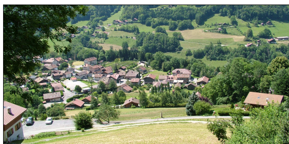
FIGURE 114 - LE BOURG GROUPÉ DU PETIT BORNAND