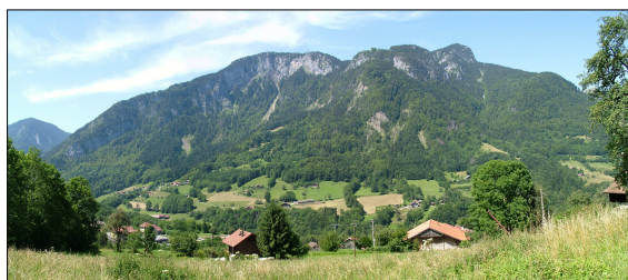
FIGURE 113 - UNE ORGANISATION HUMAINE ÉTAGÉE, CLASSIQUE DE LA MOYENNE MONTAGNE