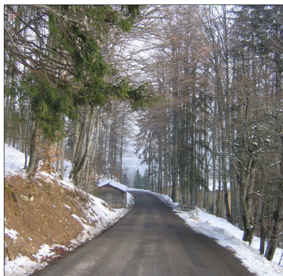
FIGURE 117 - LES BOISEMENTS LIMITENT LES VUES SUR LA VALLÉE, RENFORÇANT LE SENTIMENT D'ISOLEMENT DU VILLAGE

de toute construction de vastes espaces. Le bâti est un bâti sommaire, à l'aspect de granges, majoritairement construit de planches clouées. Ce bâti donne une ambiance particulière au lieu : ni station de montagne, ni station village, mais simplicité et respect de la nature environnante.