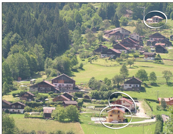
FIGURE 115 - DES HAMEAUX GROUPÉS, TRÈS LISIBLES AU SEIN DES PRAIRIES DE PENTE

LA LOI MONTAGNE s'applique sur ces territoires. Elle vise à « préserver les espaces, paysages et milieux caractéristiques du patrimoine naturel et culturel montagnard » (Art L145-3-II).