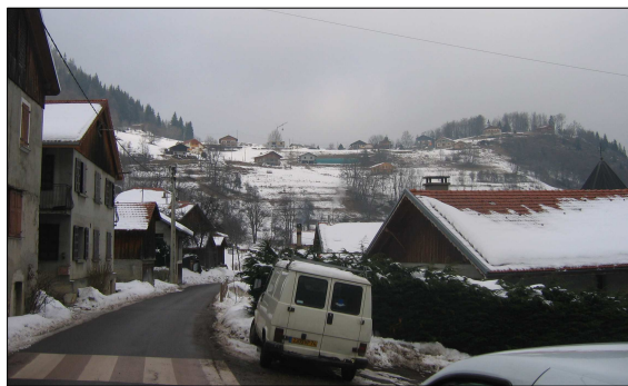
FIGURE 116 - AUTOUR DU VILLAGE, LES PENTES SE REFERMENT (BOISEMENTS) ET LE MITAGE EST TRÈS PRÉSENT

Leurs couleurs sont souvent plus claires. Elles se distinguent facilement du reste des constructions jusqu'à parfois rompre l'harmonie de certains hameaux en focalisant le regard (Figure 115, page 193). Or ces pentes sont les espaces les plus visibles pour les visiteurs. Ils donnent d'emblée une image à cette porte d'entrée dans le massif des Aravis. La maîtrise de leur avenir est donc essentielle (secteur d'intérêt paysager 12, page 201).