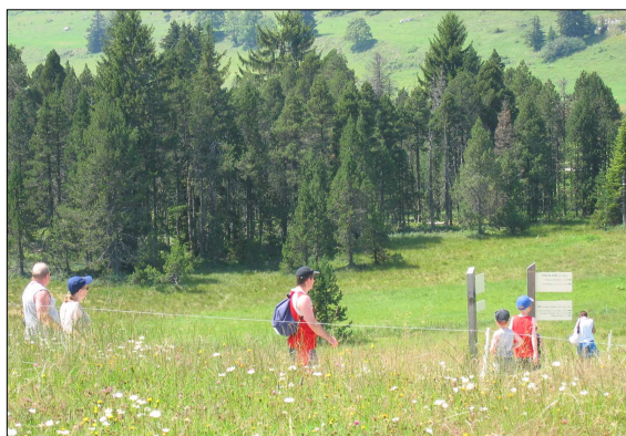
FIGURE 119 - DES ALPAGES ISOLÉS, ESPACES DE LIBERTÉ ET DE JEU PEU PERCEPTIBLES DEPUIS LA VALLÉE

Le plateau des Glières est le lieu le plus fréquenté de la commune du Petit Bornand, par les habitants comme les touristes, pour sa valeur historique, son originalité liée aux vastes espaces plats et ouverts (Figure 120, ci-contre). L'accès par le Petit-Bornand reste toutefois confidentiel par rapport à Thorens : route d'accès difficile, arrivée « dans les pots d'échappement », faible valorisation de l'accueil côté Petit-Bornand. Les autres alpages sont moins accessibles mais conservent ainsi leur caractère sauvage.